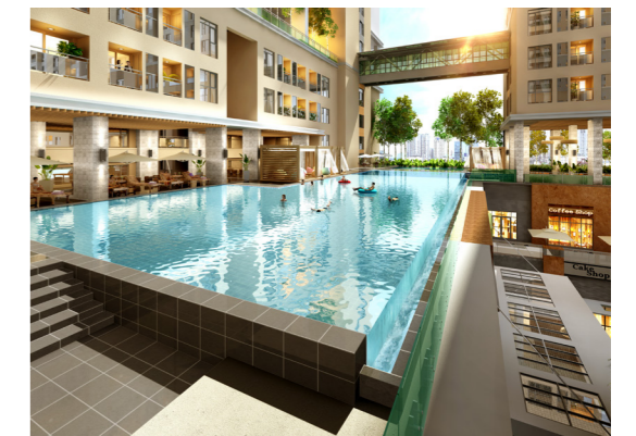
Phối cảnh hồ bơi tràn